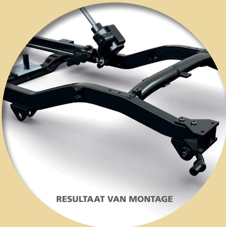
RESULTAAT VAN MONTAGE